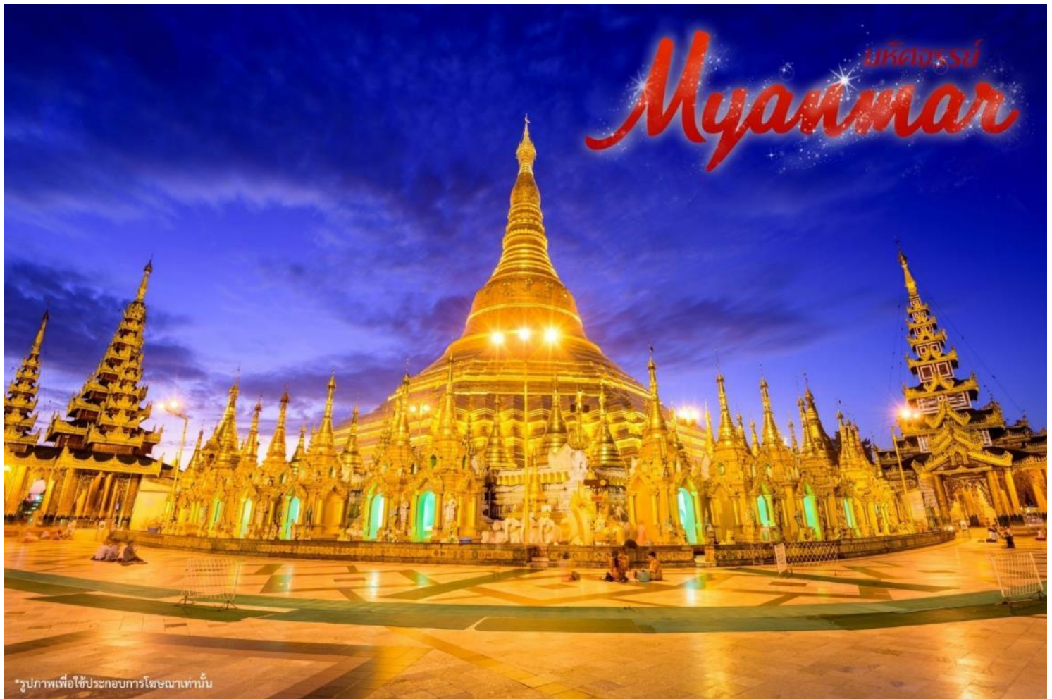
*รูปภาพเพื่อใช้ประกอบการโฆษณาเท่านั้น